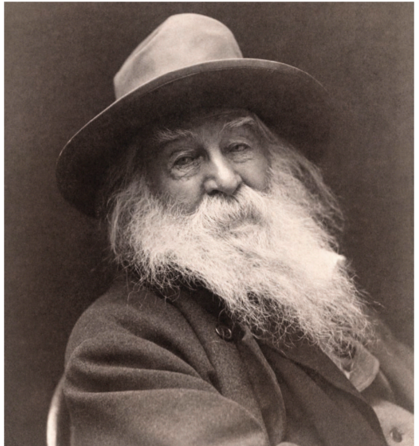
Walt Whitman (1819–1892). Biletet er teke i 1867.

Innsikta formidlar han ikkje grandios og altomfemnande som Whitman, men deadpan , lakonisk og skjelmisk, med eit referansemetta pokerandlet. Det gjeld røysta òg, som snart er